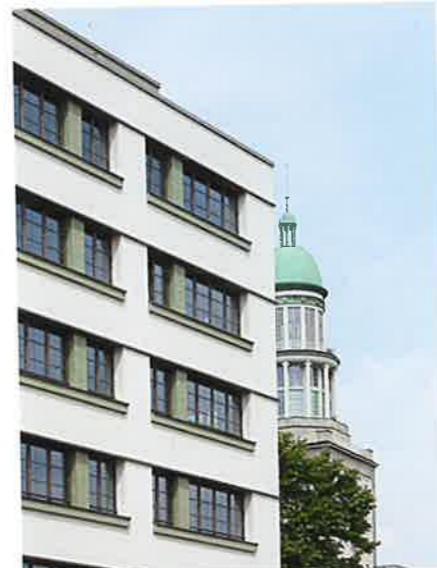
Fassade zur Straße

Umbau und Erweiterung eines Bürokomplexes von 1974. Der zweiflügelige Stahlbetonfertigteiltbau wurde völlig entkernt und erhielt ein Staffelgeschoss. Im Innenhof liegen zwei neu gebaute Gartenhäuser. Insgesamt entstanden so 567 Wohnungen, darunter 485 Studierendenwohnungen mit Küchenzeile und Bad in Größen von 18 bis 24 Quadratmetern und 82 Mikroapartments, die 25 bis 39 Quadratmeter groß sind. Im Erdgeschoss liegen Flächen für Gastronomie und Gewerbe. Zentraler Anziehungspunkt ist die Studierendenlobby. Sie bietet Raum für Gemeinschaftskonzepte und ist flexibel nutzbar. Das Ensemble grenzt an die denkmalgeschützte Bebauung von Hermann Henselmann an Karl-Marx-Allee und Frankfurter Allee. Grüne Elemente an der neuen Fassade verweisen auf deren Kupferkuppeln. Auch die Quersprossung der neuen Fenster ist den benachbarten Turmbauten entlehnt.