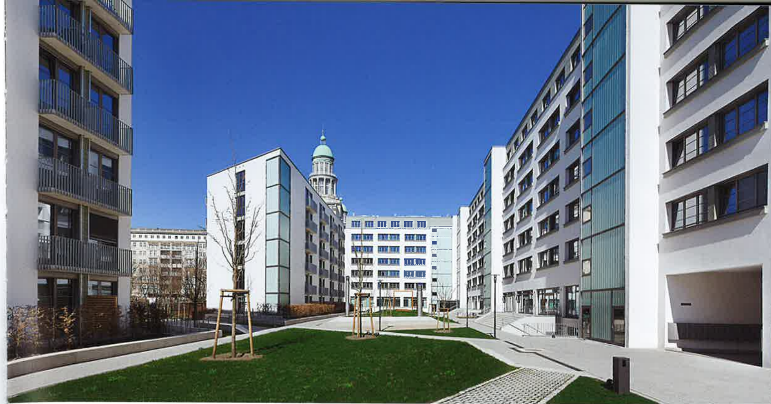
Ansicht vom Hof (oben), Mikroapartment und Studierendenwohnung (unten)