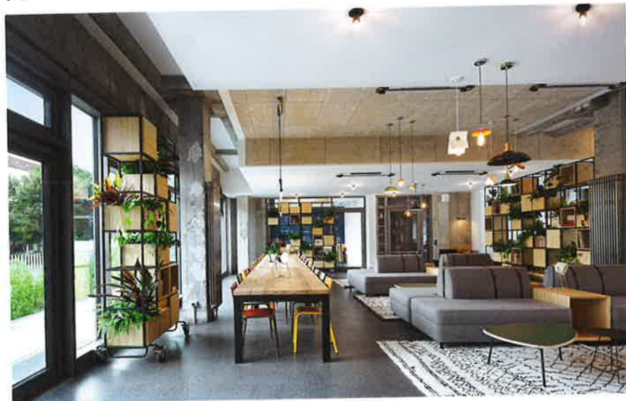
Lobby der Wohnungen für Studierende